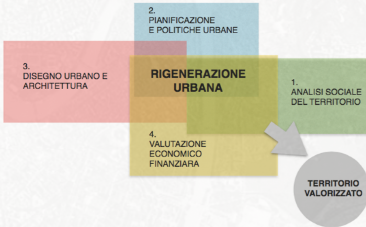
Fig. 1 Proposta schema di lavoro con propedeuticità